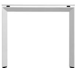
FrameOne 固定腿 (H720毫米)