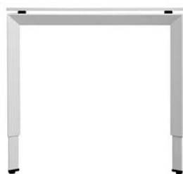
FrameOne 伸缩腿 (H620-900毫米)