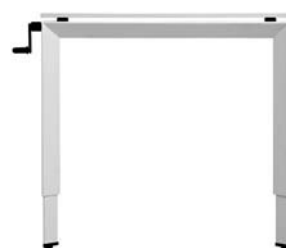
FrameOne 曲柄腿 (H620-900毫米)